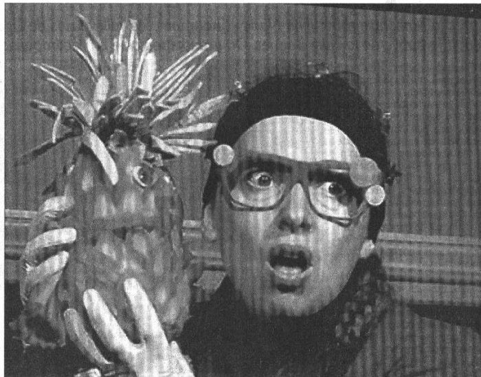
Avec son spectacle Comme des images , la Compagnie Ô propose une découverte amusante du monde de l'art.

La chambre en Arles de Vincent Van Gogh, Intérieur au phonographe d'Henri Matisse, La Liseuse de Pablo-Picasso et Composition suprématiste de Kasimir Malevitch servent de support de choix aux pérégrina-